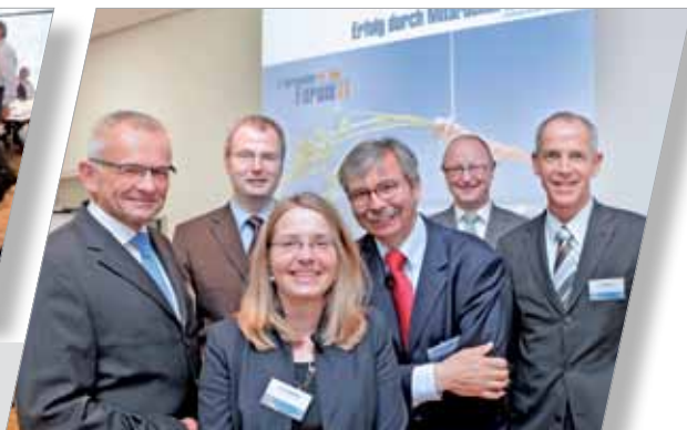
6. Darmstädter Forum für Arbeits- recht und Personalmanagement: Unternehmenserfolg durch Mitar- beitermotivation – Leistungen positiv beeinflussen 11. Mai 2011