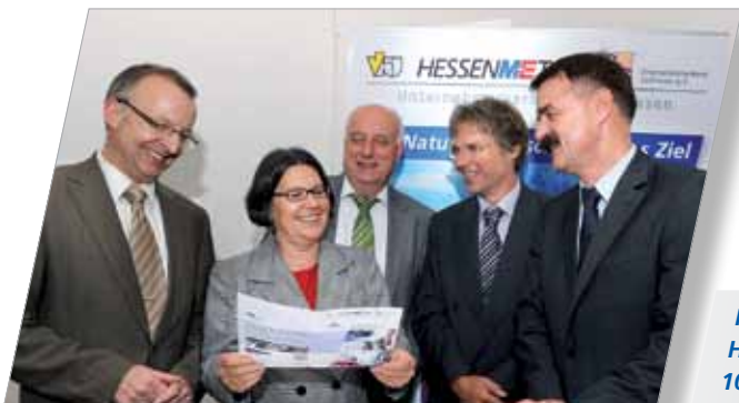
Kick-Off Arbeitskreis Hochschule-Wirtschaft 10. Juni 2011