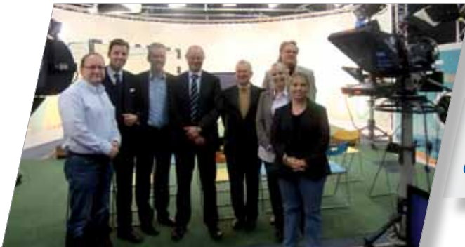
Privatfernsehen in der Region: Wirtschafts- nachrichten im Fokus 07. November 2011