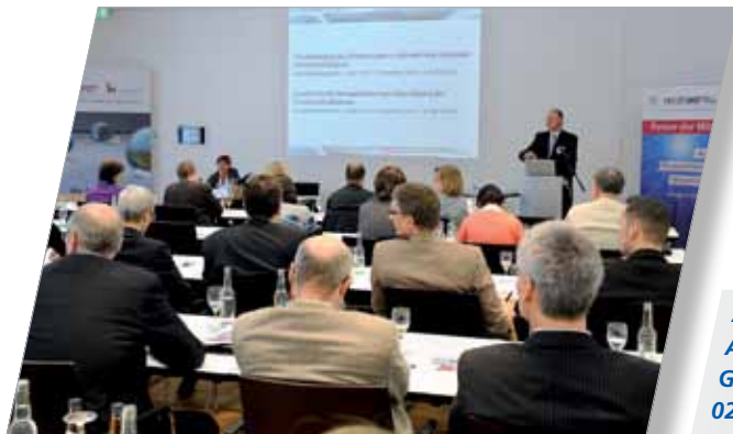
Aktuelle Rechtsprechung Arbeitsrecht Gesetzliche Neuerungen 02. Februar 2011