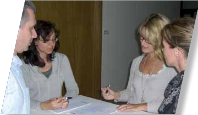
Pressearbeit professionalisieren oder: Wie man erfolgreich zum Punkt kommt 25. August 2011