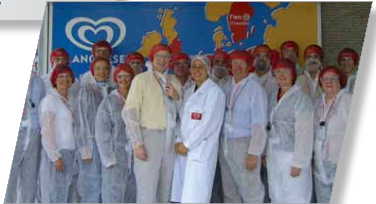
Ausbildungsleiterkreissitzung Unilever Deutschland Produktions GmbH & Co. OHG Sourcing Unit Heppenheim 13. September 2011